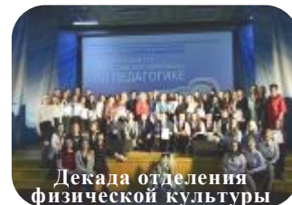
Декада отделения физической культуры

От студентов принимайте С 8 Марта поздравления, Мы желаем счастья вам, Радости и вдохновения.