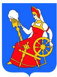
Рис. 2. Герб города Иваново

На все иллюстрации в тексте должны быть даны ссылки.