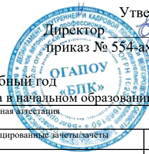
График учебного процесса на 2020-2021 учебный год специальность 44.02.05 Коррекционная педагогика в начальном образовании